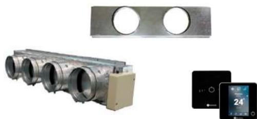
ACCESSOIRES MULTIZONE POUR GAINABLE